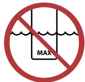
Brenner niemals über das Maximum befüllen.

Während der ersten Befüllung saugt der Keramikstein im Inneren das Bioethanol bis zur Sättigung auf. Der Brennstoff wird nach und nach vom Keramikstein absorbiert. Aus diesem Grund wird beim ersten Mal mehr Flüssigkeit verbraucht als beim Nachfüllen. Wieviel Bioethanol die verschiedenen Brenner verbrauchen, können Sie der Tabelle auf der vorherigen Seite entnehmen.