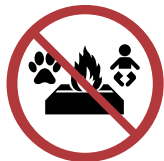
Lassen Sie keine Kinder oder Haustiere allein in der Nähe des Brenners.