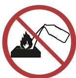
Never pour fuel into a burning appliance.