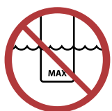
Never overfill the appliance.

When the bio ethanol burner is filled with bio ethanol for the first time, the ceramic element on the inside will be saturated completely. The liquid will always remain partly absorbed by the brick. Therefore it is necessary to use more bio ethanol the first time the burner is filled than the following times (see table on previous page).