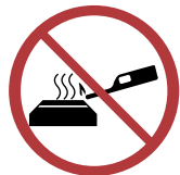
Zünden Sie niemals ein noch heißes Gerät an.