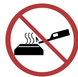
Never (re)ignite a hot appliance.