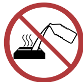
Füllen Sie niemals Brennstoff in ein heißes Gerät.