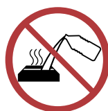
Never pour fuel into a hot appliance.