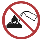
Füllen Sie niemals den flüssigen Brennstoff in ein brennendes Gerät.